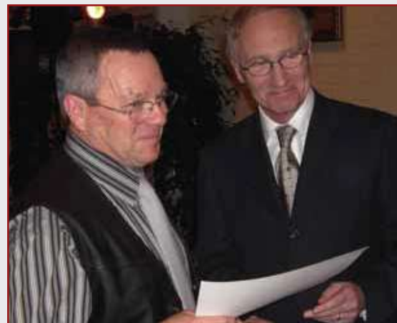
Uitreiking oorkonde aan jubilaris voor zoveel jaren lidmaatschap dansligaclub.

Dat heeft mijn inziens veel te maken met het dansmilieu waarin vele dansers zijn opgegroeid. Als zij zelf uit een uitgesproken wedstrijdmilieu voortkomen waar