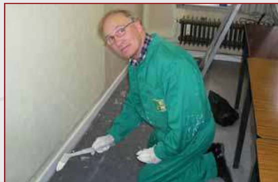
De voorzitter bij de uitoefening van zijn functie op de zetel van dansliga.