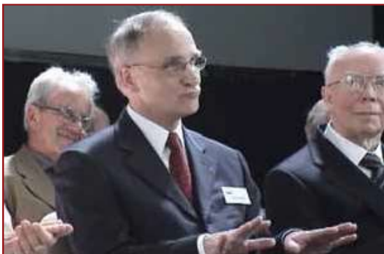
Altijd rustig blijven mensen.

Om te beginnen vind ik een voorzitter weliswaar een belangrijke schakel maar veel andere belangrijke schakels zijn nodig om het geheel te doen functioneren.