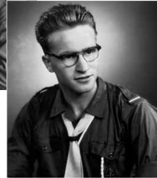
Chiroleider van 1956 tot 1966

dansjes. Na de les schreef ik alles wat we gedaan hadden meteen op. Merkwaaardig genoeg deed ik dat toen al gebruik makend van afzonderlijke vakjes voor voetposities, richtingen, draaihoeveelheid zoals in de boeken danstechniek. Ik noteerde ook de bevelen die Evers gebruikte evenals muziektitels. 'Eerbied voor jouw grijze haren' en 'Spiegelbeeld' waren toen hits.