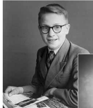
Het eerste collegejaar

Ik keek enorm op naar Evers. De man had overigens helemaal geen contact met zijn leerlingen. Hij stelde er zich hoog boven. We leerden engelse wals, foxtrot(Hollandse benaming voor QS), tango, chachacha, jive en mode-